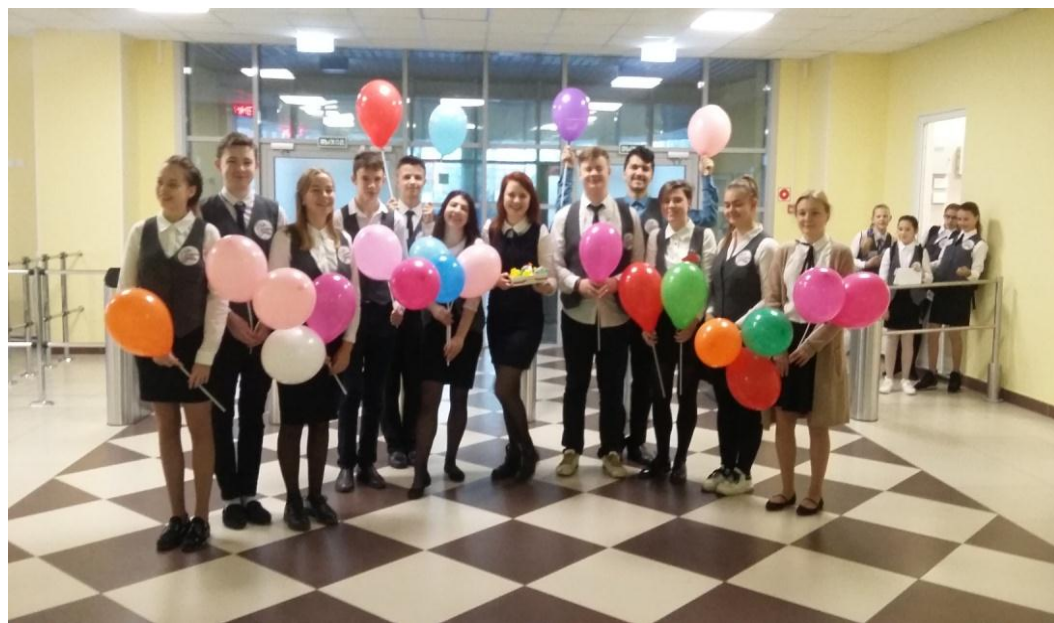
Организация праздника «День учителя»