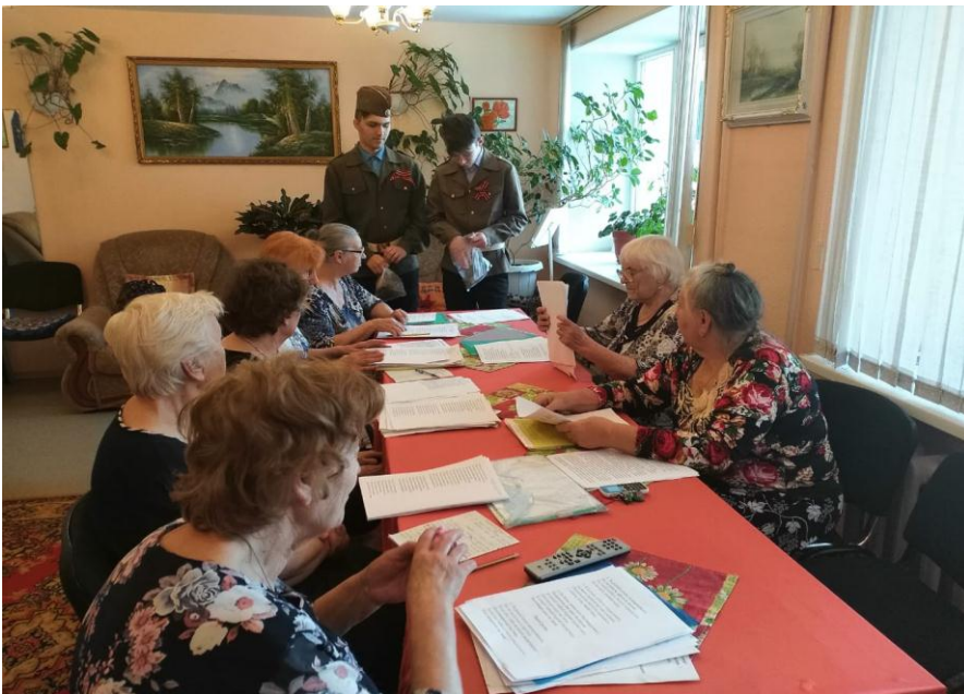
Участие во Всероссийской акции «Блокадный хлеб» (посещение «Дома Ветеранов»)