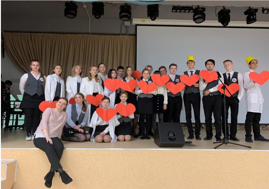
Посвящение в будущие инженеры