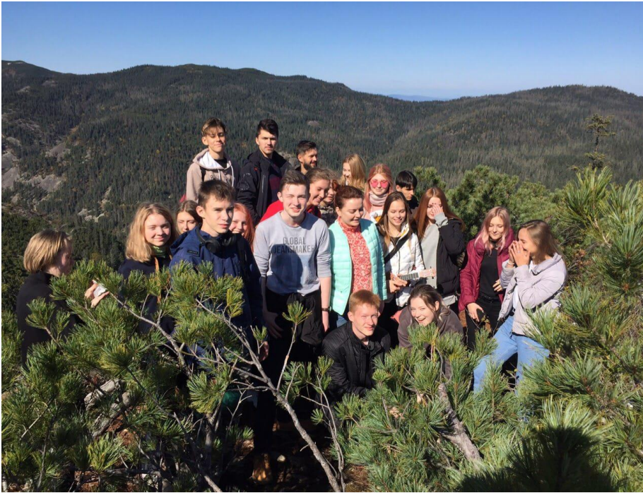
Образовательная экскурсия «Живые уроки»