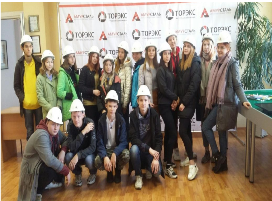
Образовательная экскурсия на завод "Амурсталь" ООО "Торэкс- Хабаровск"